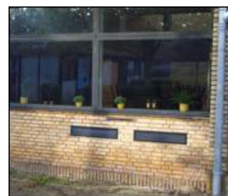
In der Mauer