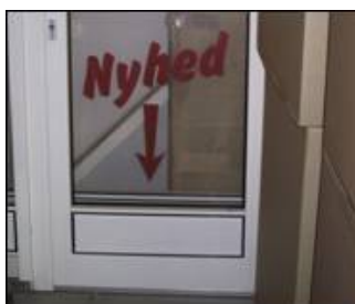
In der Tür